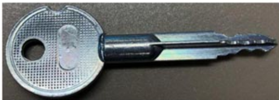
LX 110 的後備鎖匙