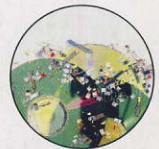
入口設計可放進多種媒體