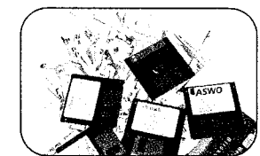
設計可處理不同媒體